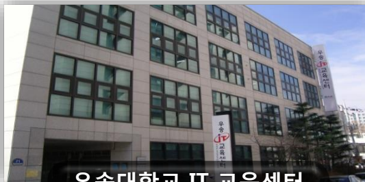
우송대학교 IT 교육센터