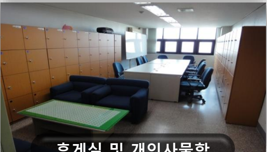
휴게실 및 개인사물함