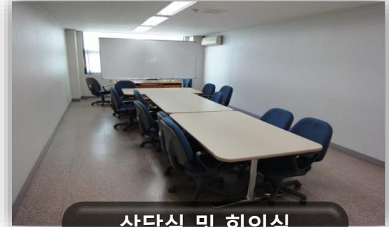
상담실 및 회의실